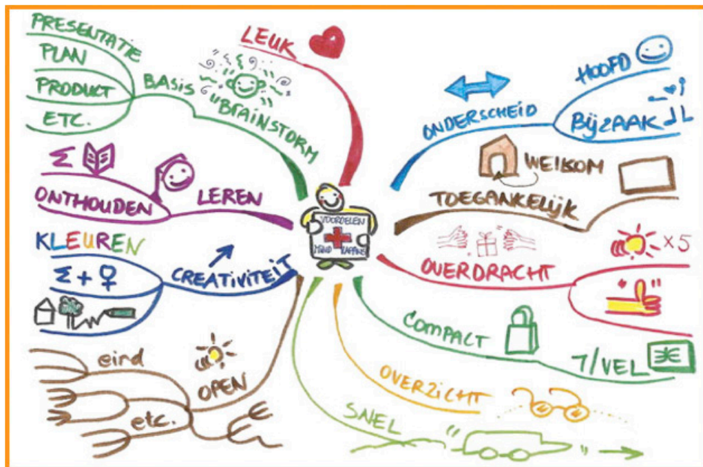
Voorbeeld van een Mindmap

Maak met de hele klas een mindmap van de verzamelde nieuwsberichten. Wat zijn de meest populaire en bijzondere nieuwsberichten die jullie verzameld hebben? Waar hebben jullie ze gevonden?